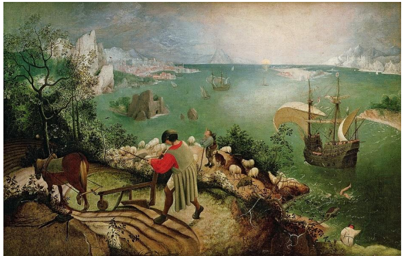
La chute d'Icare ; Bruegel

Nous continuerons notre apprentissage de la langue en abordant deux genres littéraires : le roman et la poésie.