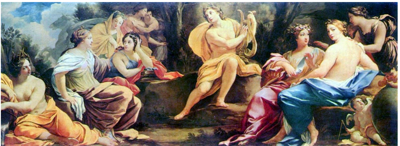
Héraldie ; les neuf muses

Nous étudierons d'abord l'un des premiers récits en prose qui narre les aventures cocasses d'un affranchi vaniteux. Puis nous laisserons parler les poètes et leurs Muses : Ovide sera notre maître.